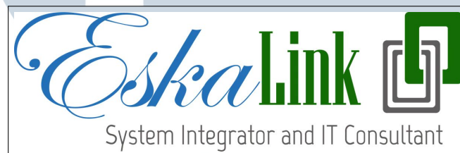
Gambar 2.1. Logo PT ESKA LINK

PT ESKA LINK adalah perusahaan yang bergerak di bidang integrator sistem ( system integrator ) dan konsultan TI ( IT consultant company ). Perusahaan ini didirikan pada tahun 2011 dan telah berpengalaman dalam mengembangkan berbagai solusi sistem informasi yang mendukung kebutuhan bisnis di berbagai sektor industri. Hingga tahun 2025, PT ESKA LINK telah melayani lebih dari 70 klien dari beragam bidang usaha [3]. Logo resmi perusahaan dapat dilihat pada Gambar 2.1, yang menjadi identitas utama dalam berbagai media publikasi dan dokumen perusahaan.