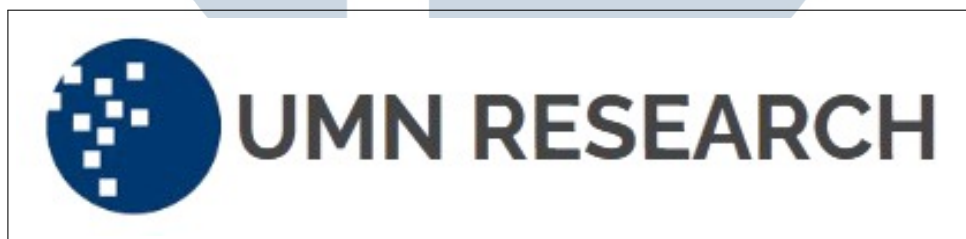
Gambar 2.1. Logo Lembaga RIS [4]

Universitas Multimedia Nusantara (UMN) merupakan institusi pendidikan tinggi swasta yang secara berkelanjutan menjalankan Tri Dharma Perguruan Tinggi, khususnya pada bidang penelitian dan pengabdian kepada masyarakat. Sebagai bentuk penguatan komitmen tersebut, UMN mendirikan Lembaga Penelitian dan Pengabdian kepada Masyarakat (LPPM) pada bulan Mei 2009 berdasarkan keputusan Yayasan Multimedia Nusantara. Seiring dengan perkembangan kelembagaan, LPPM kemudian mengalami transformasi dan dikenal sebagai Research, Innovation, and Sustainability (RIS). Logo resmi lembaga RIS Universitas Multimedia Nusantara ditampilkan pada Gambar 2.1 [4].