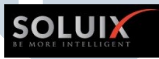
Gambar 2.1. Logo PT. Soluix Finteknologi Indonesia

Didirikan pada 4 Agustus 2018, PT Soluix Finteknologi Indonesia mengusung visi untuk menjadi entitas teknologi berskala global melalui kolaborasi strategis yang bermanfaat bagi seluruh stakeholders. Perusahaan ini mendedikasikan layanannya pada Intelligent Digital Transformation . Fokus utamanya meliputi akselerasi model bisnis, peningkatan nilai perusahaan, optimasi pengalaman pelanggan, hingga penguatan efisiensi operasional. Visualisasi identitas perusahaan dapat dilihat pada Gambar 2.1.