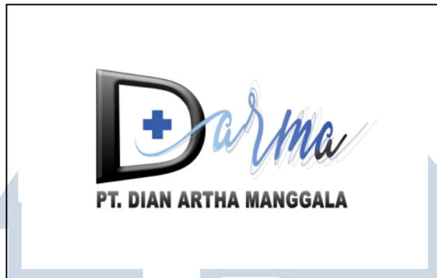
Gambar 2.1. Logo Lama PT Dian Artha Manggala

Seiring perkembangan perusahaan dan kebutuhan untuk tampil lebih profesional di dunia digital, pimpinan meminta dilakukan pembaruan identitas visual. Penulis terlibat langsung dalam proses desain ulang logo tersebut. Hasil redesain ditampilkan pada Gambar 2.2, dengan tampilan yang lebih dinamis dan modern namun tetap mempertahankan simbol “tanda plus” sebagai representasi bidang kesehatan.