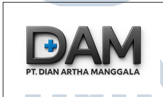
Gambar 2.2. Logo Baru PT Dian Artha Manggala

Seiring perkembangan perusahaan dan kebutuhan untuk tampil lebih profesional di dunia digital, pimpinan meminta dilakukan pembaruan identitas visual. Penulis terlibat langsung dalam proses desain ulang logo tersebut. Hasil redesain ditampilkan pada Gambar 2.2, dengan tampilan yang lebih dinamis dan modern namun tetap mempertahankan simbol “tanda plus” sebagai representasi bidang kesehatan.