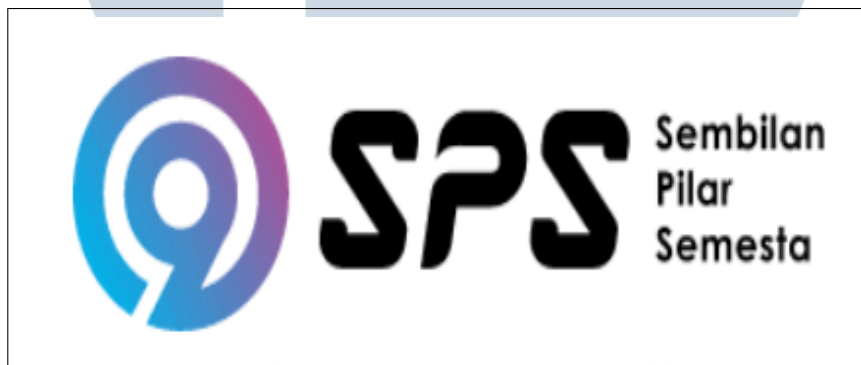
Gambar 2.1. Logo perusahaan PT Sembilan Pilar Semesta

Sembilan Pilar Semesta adalah sebuah perusahaan yang menyediakan layanan MSSP (Managed Security Service Provider) yang didirikan pada Mei 2021. Perusahaan ini berfokus pada layanan keamanan siber yang mayoritas timnya memiliki banyak individu dengan keterampilan dan sertifikasi keamanan siber defensif dan ofensif. PT Sembilan Pilar Semesta memastikan bahwa setiap client yang dimiliki selalu terjaga, terlindungi dari ancaman serangan siber kapanpun dan dimanapun.