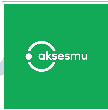
Gambar 2.1. PT. Sumber Trijaya Lestari (Aksesmu)

Perjalanan bisnis perusahaan diawali pada tahun 2008 melalui produk bernama Alfamikro, yang pada tahap awal berfungsi sebagai distributor dengan menyediakan stok barang dari PT. Sumber Alfaria Trijaya Tbk bagi pedagang warung. Langkah signifikan menuju digitalisasi diambil pada tahun 2016 dengan peluncuran aplikasi Alfamikro untuk mempermudah transaksi. Transformasi strategis mencapai puncaknya pada tahun 2022, di mana Alfamikro secara resmi melakukan rebranding menjadi Aksesmu.