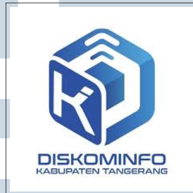
Gambar 2.2. Logo Dinas Komunikasi dan Informatika Kabupaten Tangerang.

Logo Dinas Komunikasi dan Informatika Kabupaten Tangerang digunakan sebagai identitas visual instansi pada berbagai media, baik cetak maupun digital. Logo ini umumnya dicantumkan pada dokumen resmi, laman web, serta materi publikasi yang dikelola oleh DISKOMINFO.