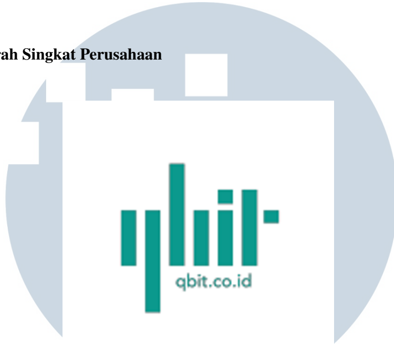
Gambar 2.1. Logo PT Vanz Inovatif Teknologi

PT Vanz Inovatif Teknologi didirikan pada Juli 2017 sebagai perusahaan yang bergerak di bidang teknologi informasi dengan layanan utama bernama “qbit.” Perusahaan ini berfokus pada pengembangan dan penyediaan solusi digital terintegrasi dengan pendekatan berbasis prinsip kuantum untuk menjawab berbagai kebutuhan bisnis modern. Sejak berdirinya, perusahaan senantiasa berkomitmen untuk menghadirkan produk dan proyek yang inovatif, adaptif, serta dirancang sesuai kebutuhan dan ekspektasi klien.