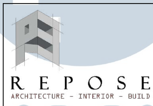
Gambar 2.1. Logo PT Rekatama Pola Sejahtera (REPOSE)

Struktur dan identitas visual perusahaan juga mencerminkan karakter profesional REPOSE sebagai penyedia layanan konstruksi dan arsitektur yang berorientasi pada kualitas serta presisi desain.