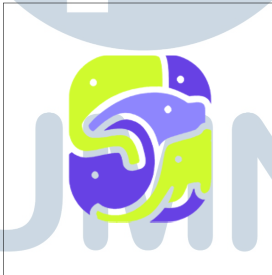
Gambar 2.1. Logo perusahaan PT. Gajah Terbang Kreatif

Gambar 2.1 merupakan logo dari PT. Gajah Terbang Kreatif, sebuah perusahaan rintisan ( start-up ) yang bergerak di bidang industri kreatif digital, yang bertugas untuk menyediakan solusi digital yang komprehensif bagi bisnis modern. Sejak didirikan, PT. Gajah Terbang Kreatif berfokus pada penyelenggaraan berbagai layanan kreatif melalui tiga pilar bisnisnya, yaitu Godjah (jasa foto dan video produk), Godtive ( creative digital marketing ), dan Godweb (pengembangan website), agar dapat mendukung brand klien menjadi lebih profesional, menarik, dan kompetitif di pasar digital. Selain itu, PT. Gajah Terbang Kreatif juga berperan dalam memberikan konsultasi strategi untuk meningkatkan efektivitas pemasaran dan kehadiran digital klien di seluruh platform.