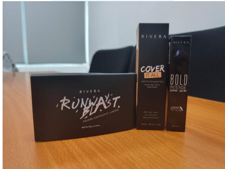
Gambar 2.5 Hasil Cetak Produk Rivera dibuat oleh CV Indah Kencana

Rivera merupakan brand lokal yang memproduksi kosmetik dan skincare yang didirikan di tahun 1991 oleh PT Fabindo Sejahtera.