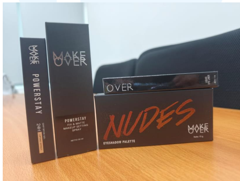
Gambar 2.3 Hasil Cetak Produk Make Over dibuat oleh CV Indah Kencana

Make Over merupakan salah satu brand kosmetik local di Indonesia yang dikelola oleh PT. Paragon Technology and Innovation yang memproduksi berbagai produk kecantikan yang dikhususkan sesuai dengan standar kecantikan alami wanita di Indonesia (Make Over, 2025).