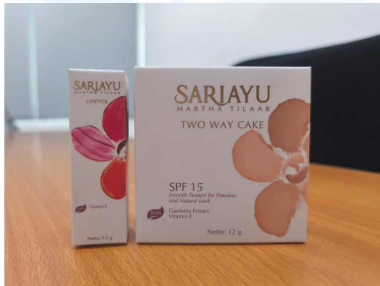
Gambar 2.4 Hasil Cetak Produk Sariayu dibuat oleh CV Indah Kencana

Sariayu merupakan brand kecantikan yang dibangun oleh PT. Martina Berto TBK pada tahun 1977. Produk-produk Sariayu membawakan khas tradisi Indonesia dengan nilai-nilai budaya dan sejarah kemudian diangkat menjadi motif dari brand nya. Sariayu memiliki visi untuk mempercantik wanita-wanita Indonesia (Sariayu, 2021).