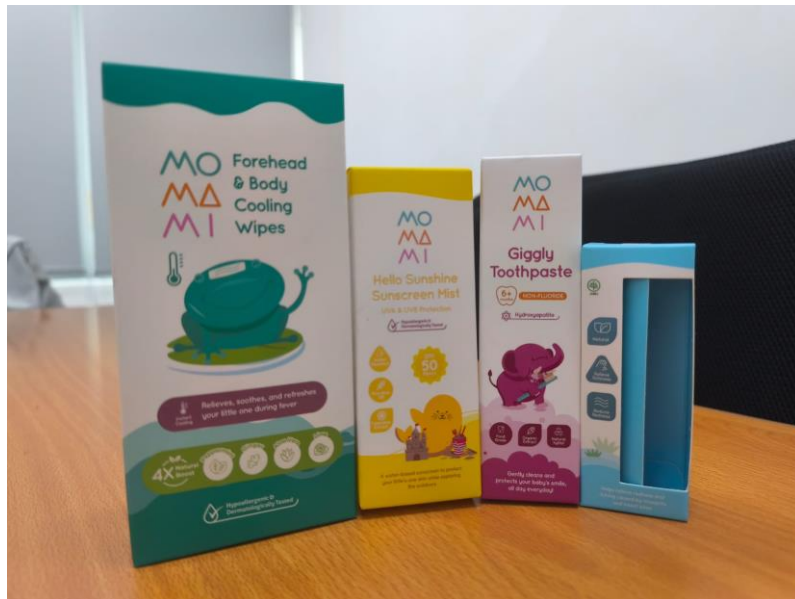
Gambar 2.6 Hasil Cetak Produk Sariayu dibuat oleh CV Indah Kencana

CV Indah Kencana sebagai pabrik kemasan yang dipercayainya, menyediakan tanggung jawab untuk menghasilkan kemasan dengan desain yang menyenangkan. Mereka telah memproduksi banyak desain untuk beberapa produk seperti sunscreen , baby oil , hair serum , dan produk-produk lainnya untuk anak-anak.