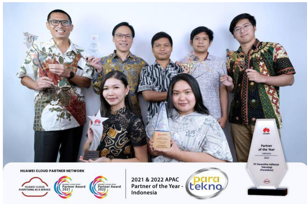
Gambar 2.3 Partner of the Year 2022 (Huawei)