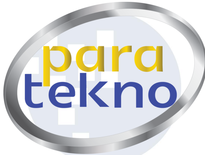
Gambar 2.1 Logo Paratekno

PT Paramitha Adikarya Teknologi, atau yang lebih dikenal dengan nama Paratekno, merupakan perusahaan yang bergerak di bidang teknologi informasi dan berlokasi di Jakarta Barat. Perusahaan ini menyediakan berbagai layanan berbasis teknologi, mulai dari pengembangan aplikasi, layanan cloud-native , hingga solusi transformasi digital untuk berbagai sektor industri. Latar belakang perusahaan berakar dari divisi Teknologi Informasi milik ATT Group, sebuah perusahaan logistik nasional yang telah beroperasi selama bertahun-tahun. Divisi tersebut berkembang pesat akibat meningkatnya kebutuhan teknologi di sektor logistik, hingga akhirnya berdiri secara resmi sebagai entitas usaha tersendiri pada tahun 2016.