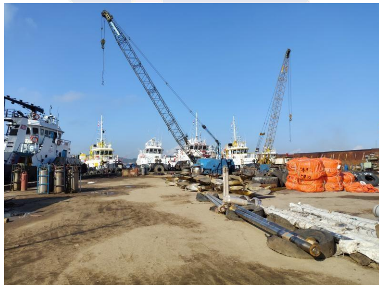
Gambar 2.3 Perbaikan Kapal

Perusahaan Dok Pendingin menangani berbagai jenis kapal yang membutuhkan perawatan, perbaikan, dan pengecekan kondisi operasional. Gambar 2.3 sampai gambar 2.7 menunjukkan dokumentasi visual dari beberapa kapal yang sedang dalam proses perbaikan di area kerja perusahaan, mulai dari tahap pemeriksaan, pembongkaran komponen, hingga proses pemeliharaan menyeluruh. Dokumentasi tersebut menunjukkan aktivitas operasional perusahaan secara langsung dan menunjukkan ruang lingkup pekerjaan yang cukup kompleks yang membutuhkan koordinasi antar divisi.