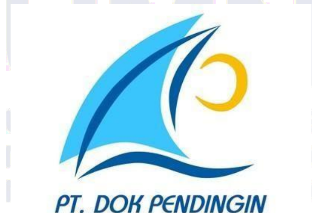
Gambar 2. 1 Logo Perusahaan Dok Pendingin

Visi dan Misi Dok Pendingin adalah menjadi salah satu perusahaan industri perkapalan yang kompetitif dan terpercaya dalam menghadapi persaingan global serta meningkatkan produktivitas galangan yang cepat dan efektif dan terpercaya dalam lingkup industri perkapalan dan meningkatkan pendapatan masyarakat yang bergerak di sektor kelautan[8].