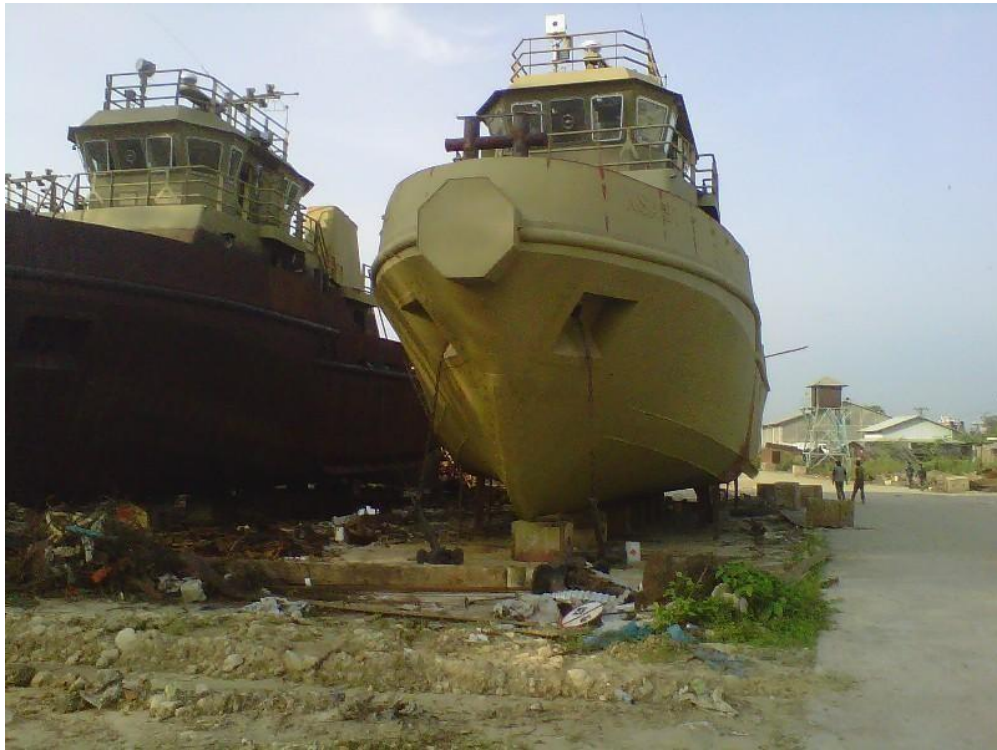
Gambar 2. 6 Perbaikan Kapal Tugboat[8]