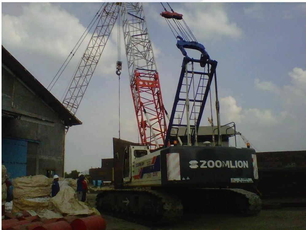
Gambar 2. 7 Alat Berat yang digunakan[8]