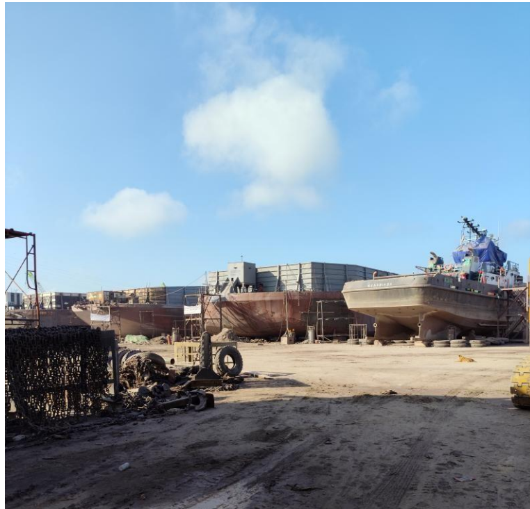
Gambar 2. 4 Perbaikan Kapal Tongkag