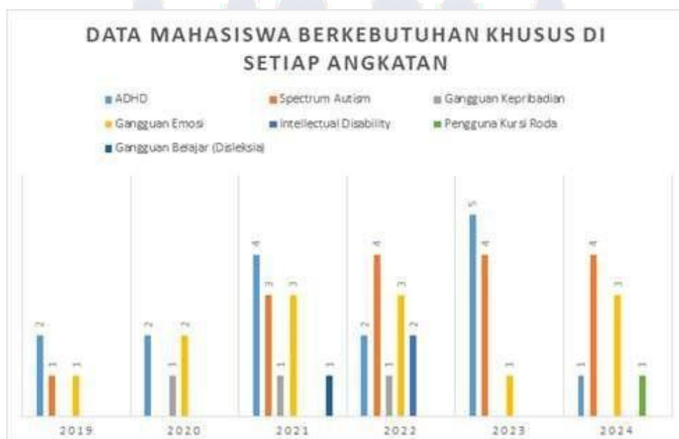
Gambar 2.1 Data Mahasiswa Berkebutuhan Khusus

Salah satu bagian penting dalam layanan ULD UMN adalah pendataan mahasiswa penyandang disabilitas. Pendataan dilakukan sejak awal mahasiswa melakukan registrasi ulang ataupun saat mahasiswa menjalani konseling secara sukarela di Student Support. Bagi mahasiswa yang belum memiliki surat diagnosis, keterangan sementara dapat diberikan berdasarkan laporan klinis dari psikolog Student Support UMN. Pendataan ini menjadi dasar dalam merancang layanan, intervensi, serta dukungan yang sesuai dengan kebutuhan tiap mahasiswa.