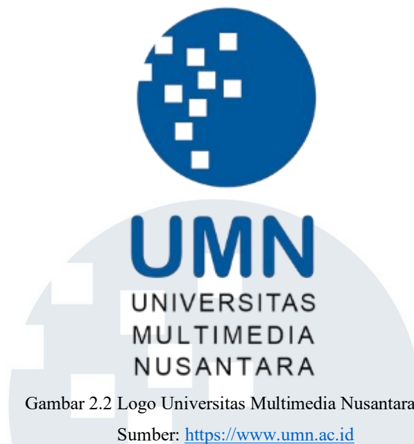
Gambar 2.2 Logo Universitas Multimedia Nusantara