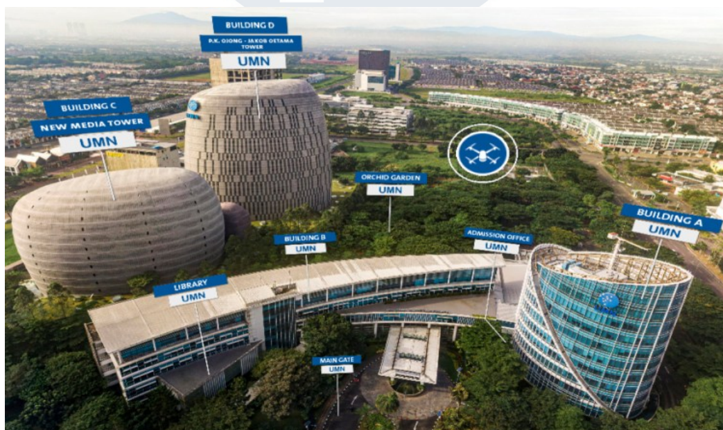
Gambar 2.1 Universitas Multimedia Nusantara

Universitas Multimedia Nusantara (UMN) dikenal sebagai universitas swasta di bidang Information and Communication Technology (ICT) yang beralamat di Tangerang, kawasan Gading Serpong, Provinsi Banten. Sebuah perusahaan media terkemuka di Indonesia, yakni Kompas Gramedia Group, adalah yang memayungi UMN, yang didirikan pada tahun 2006. Setelah menerima izin operasional dari Menteri Pendidikan Nasional Republik Indonesia pada tanggal 25 November 2005, UMN secara resmi mulai beroperasi sebagai universitas swasta pada tanggal 20 November 2006. Jakob Oetama, seorang pemimpin umum dari Kompas Gramedia, menjadi satu dari sekian orang berpengaruh yang ikut dalam pembentukan UMN.