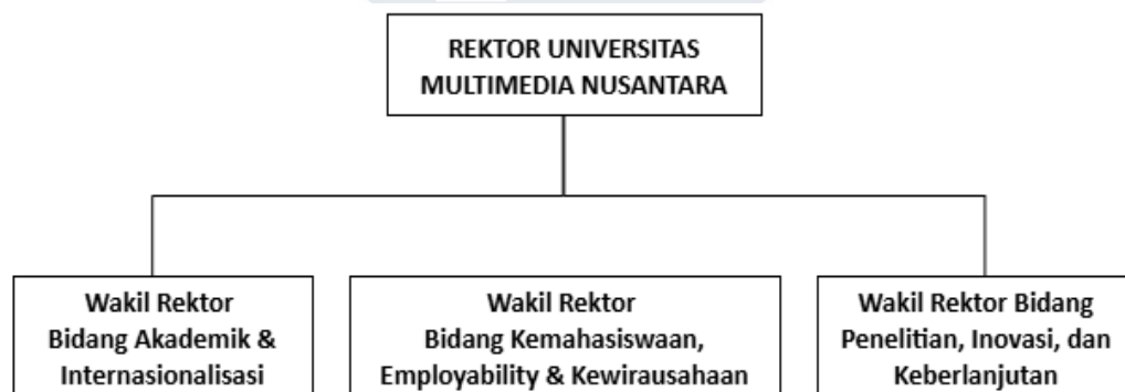
Gambar 2.3 Bagan Struktur Rektorat Universitas Multimedia Nusantara

Setiap organisasi mempunyai strukturnya masing-masing. Hal ini tidak terkecuali bagi Universitas Multimedia Nusantara yang dipimpin oleh seorang Rektor, serta didukung oleh lima Wakil Rektor di berbagai bidang. Entah itu di bidang akademik, administrasi umum dan keuangan, maupun kemahasiswaan. Tidak sampai di situ, terdapat dekan yang juga mengepalai masing-masing fakultas beserta ketua program studinya. Selain itu, ada juga divisi hubungan dan kerja sama, serta penelitian dan pengabdian masyarakat. Adapun bagan dari struktur organisasi universitas yang dapat disaksikan di sini.