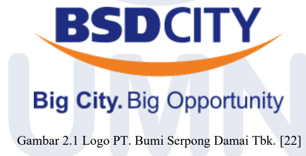
Gambar 2.1 Logo PT. Bumi Serpong Damai Tbk. [22]

PT. Bumi Serpong Damai Tbk. (BSD) merupakan salah satu pengembang kota mandiri terbesar di Indonesia yang bergerak di bidang pengembangan properti terpadu, meliputi pembangunan kawasan hunian, komersial, industri, perkantoran, serta fasilitas publik [22]. Perusahaan ini didirikan pada 16 Januari 1984 oleh para pemegang saham pendiri ( Founding Shareholders ) dengan tujuan untuk mewujudkan kota baru yang modern, tertata, dan mampu memenuhi kebutuhan masyarakat terhadap lingkungan tempat tinggal yang nyaman, aman, serta terintegrasi [23]. Pusat kegiatan utama PT. Bumi Serpong Damai Tbk. berlokasi di Pagedangan, Kabupaten Tangerang, Provinsi Banten, yang kini dikenal luas sebagai BSD City . Gambar 2.1 menampilkan identitas PT. Bumi Serpong Damai Tbk yang tercermin melalui logo resminya.