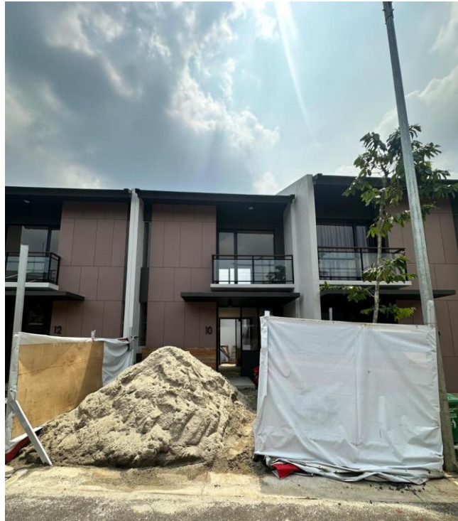
Gambar 2. 3 Salah Satu Proyek Renovasi

Dokumentasi ini menampilkan salah satu proyek renovasi yang dikerjakan oleh perusahaan, mulai dari kondisi awal hingga hasil akhir pengerjaan. Proyek ini menunjukkan kemampuan perusahaan dalam melakukan perencanaan, pengelolaan pekerjaan, serta eksekusi renovasi secara terstruktur dengan tetap memperhatikan kualitas, fungsi ruang, dan kebutuhan klien.