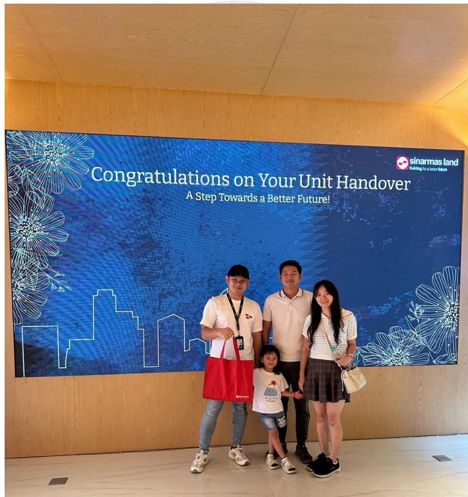
Gambar 2. 5 Serah Terima Unit

Foto gambar 2.4 diambil sebagai dokumentasi setelah proses pengerjaan proyek selesai, yang melibatkan klien dan tim pelaksana. Dokumentasi ini mencerminkan kerja sama yang baik antara perusahaan dan klien, sekaligus menjadi bukti bahwa proyek dilaksanakan dengan komunikasi yang jelas dan koordinasi tim yang solid.