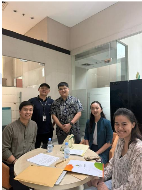
Gambar 2. 7 Akad Kredit

Foto ini menunjukkan momen penerimaan penghargaan sebagai agen terbaik, yang diberikan berdasarkan pencapaian kinerja dan kontribusi dalam bidang pemasaran maupun pelayanan kepada klien. Penghargaan ini menjadi indikator profesionalisme serta konsistensi perusahaan atau agen dalam mencapai target dan menjaga kualitas layanan.