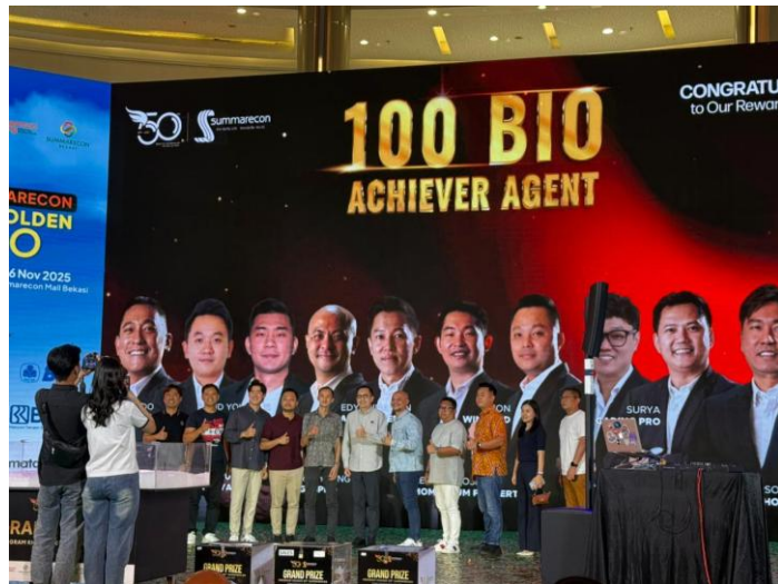
Gambar 2. 6 Award Agent Terbaik

Foto ini menunjukkan momen penerimaan penghargaan sebagai agen terbaik, yang diberikan berdasarkan pencapaian kinerja dan kontribusi dalam bidang pemasaran maupun pelayanan kepada klien. Penghargaan ini menjadi indikator profesionalisme serta konsistensi perusahaan atau agen dalam mencapai target dan menjaga kualitas layanan.