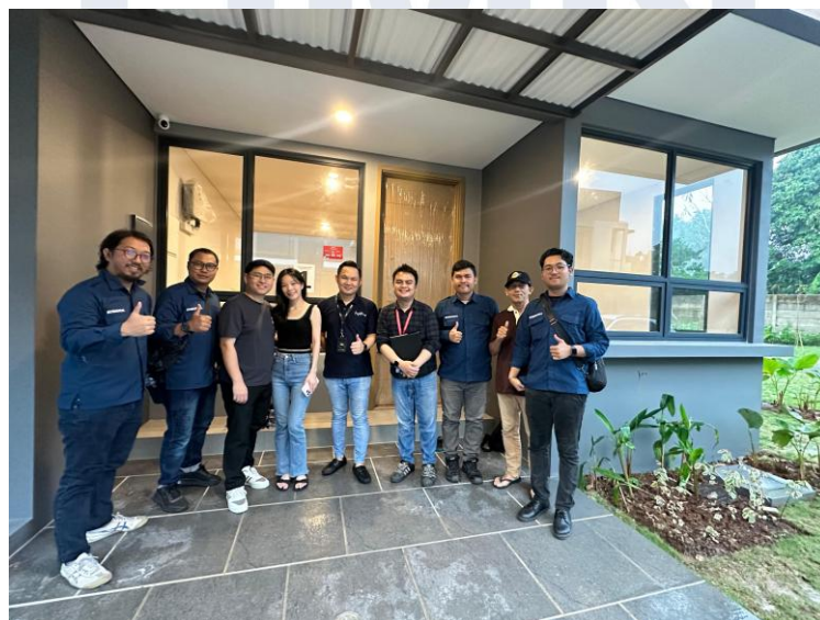
Gambar 2. 4 Foto Bersama Tim dan Client

Dokumentasi ini menampilkan salah satu proyek renovasi yang dikerjakan oleh perusahaan, mulai dari kondisi awal hingga hasil akhir pengerjaan. Proyek ini menunjukkan kemampuan perusahaan dalam melakukan perencanaan, pengelolaan pekerjaan, serta eksekusi renovasi secara terstruktur dengan tetap memperhatikan kualitas, fungsi ruang, dan kebutuhan klien.