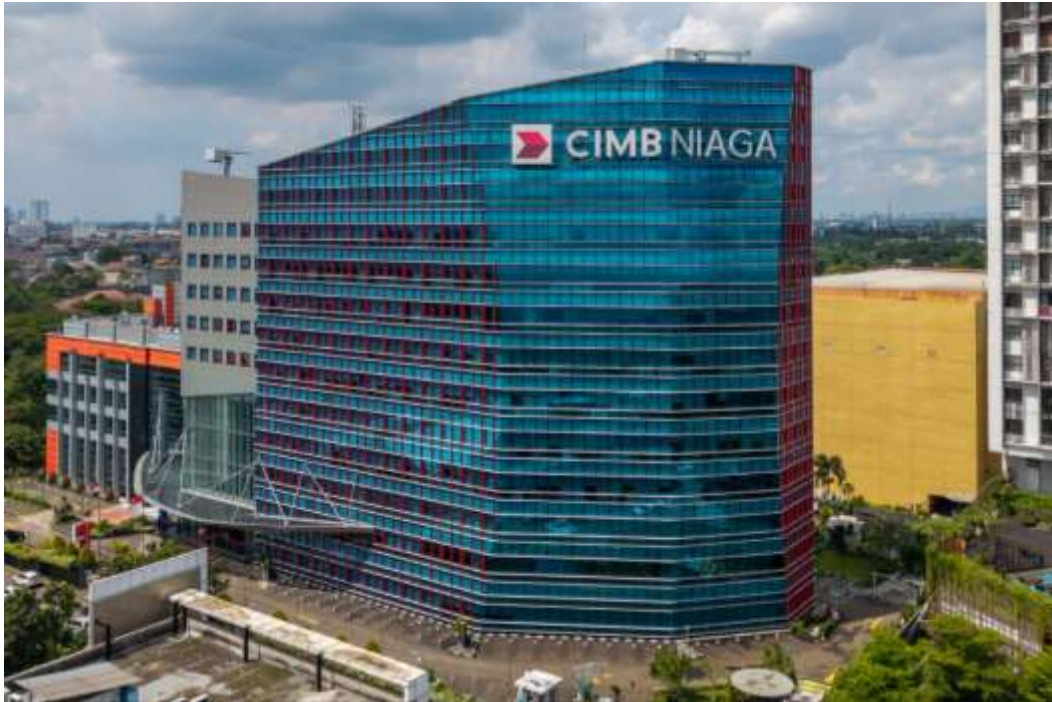
Gambar 2. 1. Kantor CIMB Niaga Bintaro [12]

Kantor pusat CIMB Niaga berlokasi di Graha CIMB Niaga, Jakarta, sementara salah satu kantor operasional utama yang ditunjukkan pada Gambar 2. 1 berada di Graha CIMB Niaga Bintaro, Tangerang Selatan, dan berfungsi sebagai pusat bagi berbagai unit bisnis. Lokasi ini dirancang untuk mendukung koordinasi antar divisi serta meningkatkan efektivitas operasional perbankan, khususnya pada bidang teknologi informasi, manajemen risiko, dan fungsi pendukung lainnya. Kantor operasional tersebut memiliki peran penting dalam menjamin efektivitas dan efisiensi proses bisnis perusahaan melalui penyediaan lingkungan kerja yang profesional serta infrastruktur yang memadai. Dengan pengalaman panjang lebih dari enam dekade, CIMB Niaga terus berkomitmen untuk menjadi bank yang inovatif, andal, dan adaptif terhadap perkembangan teknologi serta kebutuhan nasabah. Komitmen ini diwujudkan melalui penguatan tata kelola perusahaan, pengelolaan risiko yang prudent, serta pengembangan layanan perbankan yang berorientasi pada keberlanjutan dan nilai tambah bagi masyarakat. Melalui langkah-langkah tersebut, CIMB Niaga diharapkan dapat terus memberikan kontribusi nyata