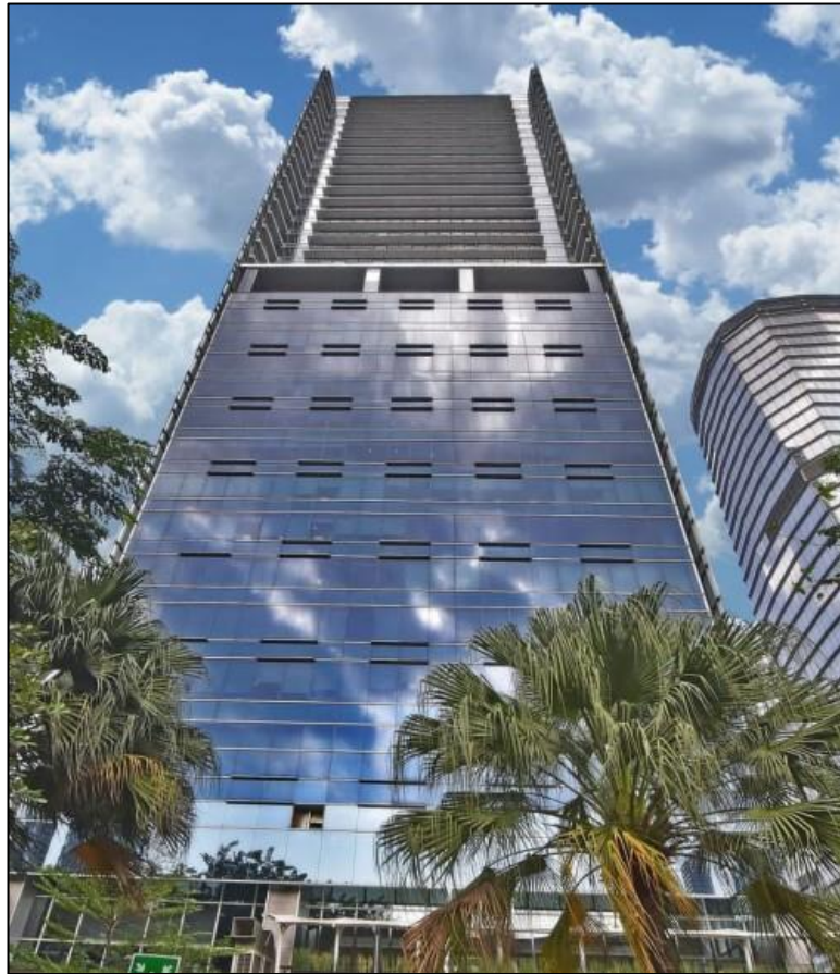
Gambar 1. Gedung Cyber 2 Tower

PT Alamtri Minerals Indonesia Tbk berlokasi di Gedung Cyber 2 Tower, Jl. HR Rasuna Said Blok X-5 No. 13, Kuningan Timur, Kecamatan Setiabudi, Jakarta Selatan, sebagaimana ditunjukkan pada Gambar 1. Gedung tersebut berfungsi sebagai kantor pusat perusahaan dan menjadi pusat kegiatan administrasi serta manajerial dalam mendukung operasional bisnis AlamTri.