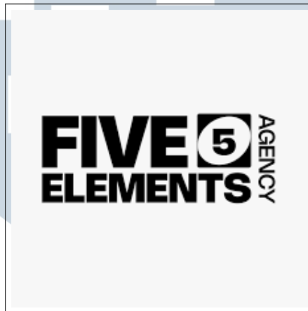
Gambar 2.1. Logo perusahaan Five Elements Agency

Five Elements Agency (FEA) didirikan pada tahun 2023 sebagai agensi kreatif dan digital yang berbasis di Bali, dengan fokus awal pada pemasaran musik dan promosi acara. Sejak berdiri, FEA telah berkontribusi dalam penyelenggaraan konser-konser berskala besar dan bekerja sama dengan artis internasional ternama seperti Oliver Tree, Rich the Kid, Tyga, FKJ, Dream Theater, Simple Plan, Secondhand Serenade, David Foster, Mr. Big, Trey Songz, dan REMA [8].