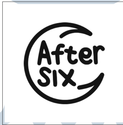
Gambar 2.1. Logo Perusahaan PT Visi Karya Nusantara