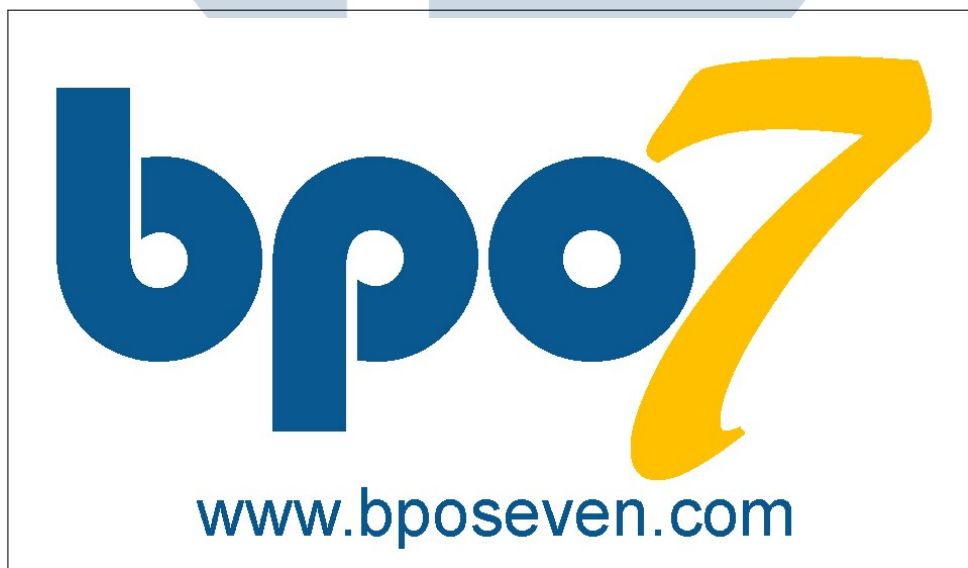
Gambar 2.1. Logo perusahaan PT. BPO Seven Inovasi Indonesia

Gambar 2.1 merupakan logo dari PT. BPO Seven Inovasi Indonesia. PT. BPO Seven Indonesia memiliki produk utama yang bernama Benemica, Benemica itu sendiri merupakan singkatan dari Beneficial, Dynamic, Accurate yang memiliki arti dimana aplikasi ini bisa memberikan poin plus dan manfaat kepada pengguna dimana aplikasi ini juga bisa mengikuti pesatnya perubahan pada perusahaan. Benemica merupakan Software Payroll dan Aplikasi HRIS, serta aplikasi lainnya yang dapat membantu pekerjaan manajemen suatu perusahaan, adapun Benemica memiliki beberapa aplikasi, yaitu ESS, Payroll, E - Payslip, Document Management, Invoice, dan Validasi NIK.