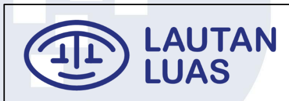
Gambar 2.1 Logo perusahaan PT Lautan Luas Tbk

Gambar 2.1 adalah logo dari PT Lautan Luas Tbk Indonesia. Perusahaan ini berdiri pada tanggal 13 Juli 1951 dengan nama NV Lim Teck Lee Coy. Ltd yang bergerak sebagai distributor dan importir bahan kimia dasar untuk bidang tekstil yaitu batik dan makanan. Pada tahun 1965, perusahaan berganti nama menjadi PT Lautan Luas Indonesia. Tanggal 18 Juni 1997, perusahaan berubah menjadi Perusahaan Terbuka dan memiliki nama di Bursa Efek Indonesia dengan kode “LTLS” [4].