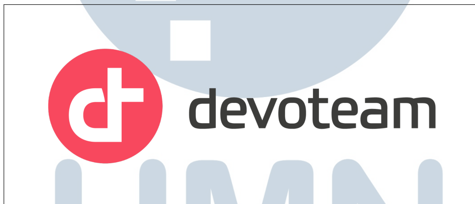
Gambar 2.1. Logo perusahaan Devoteam

Devoteam didirikan pada tahun 1995 oleh Stanislas de Bentzmann dan Godefroy de Bentzmann di Prancis, dengan tujuan untuk mengintegrasikan teknologi canggih ke dalam operasional bisnis perusahaan guna membantu mereka mengatasi tantangan digital. Sejak awal berdirinya, Devoteam fokus pada inovasi teknologi dan memberikan konsultasi strategis untuk mendorong transformasi digital di berbagai sektor. Pada tahun 1999, perusahaan ini berhasil mencatatkan sahamnya di bursa Euronext Paris , sebuah langkah penting yang menandai perkembangan dan pertumbuhannya dalam industri konsultasi teknologi.