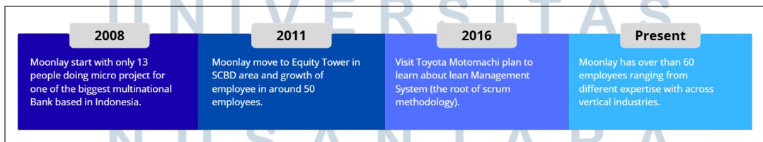
Gambar 2.2. Sejarah Singkat PT Moonlay Technologies Sumber:

Pada masa awal pendiriannya, PT Moonlay Technologies memulai kegiatan operasional dengan jumlah karyawan sekitar 13 orang. Aktivitas bisnis pada periode tersebut berfokus pada pengerjaan micro-project untuk sejumlah klien, termasuk salah satu bank terbesar di Indonesia. Seluruh kegiatan operasional pada periode awal masih dilakukan di rumah salah satu pegawai yang difungsikan sebagai kantor sementara. Sejarah singkat PT Moonlay Technologies disajikan pada Gambar 2.1.