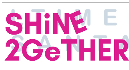
Gambar 2.1. Logo Brand Shine2Gether

Melalui Shine2Gether , perusahaan berupaya menghadirkan pengalaman perawatan kulit dan kesehatan yang setara dengan standar klinik profesional, namun tetap dapat diakses dengan mudah dari rumah. Pendekatan ini sejalan dengan filosofi “bersinar bersama” yang menjadi dasar setiap langkah pengembangan perusahaan, dimana inovasi dan kebersamaan menjadi kunci dalam memberikan dampak positif bagi masyarakat. Hingga kini, PT Sinar Sukacita Gemilang terus berkembang sebagai brand kecantikan dan kesehatan berstandar internasional yang membawa semangat optimisme, kolaborasi, dan inklusivitas dalam setiap produknya [5]. Logo perusahaan Shine2Gether dapat dilihat pada Gambar 2.1.