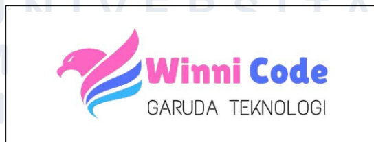
Gambar 2.1. Logo PT Winnicode Garuda Teknologi

Gambar 2.1 menunjukkan logo PT Winnicode Garuda Teknologi.