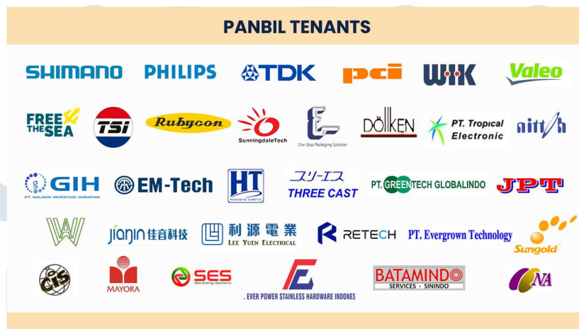
Gambar 2.4 Tenants di Panbil Industrial Estate

Panbil melalui Panbil Industrial Estate atau kawasan industri Panbil telah berhasil menjalin kerjasama dengan banyak bisnis lainnya yang dalam hal ini disebut sebagai tenant . Berikut adalah bisnis-bisnis yang terdaftar sebagai tenant di Panbil Industrial Estate.