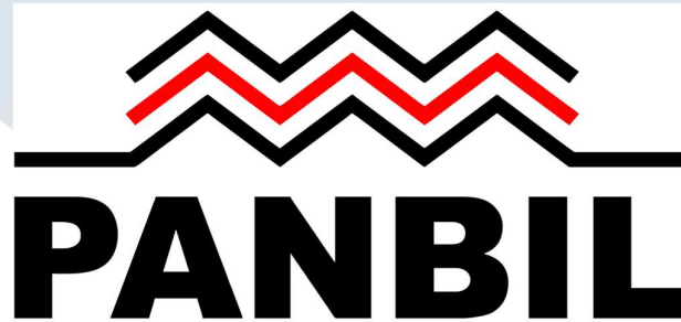
Gambar 2.1 Logo Panbil Group Sumber: Dokumen Perusahaan, 2024