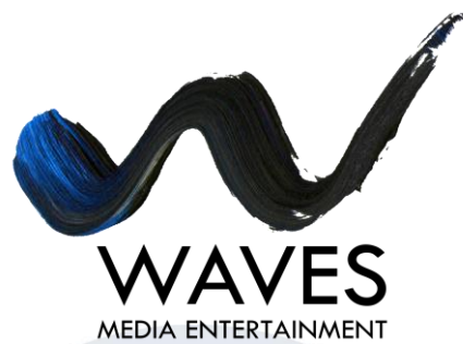
Gambar 2.1 Logo Waves Media Entertainment