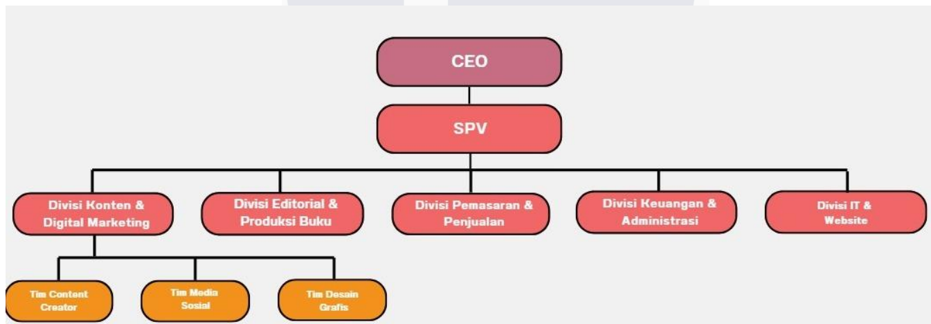
Gambar 2.2 Contoh Bagan Struktur umum Organisasi Perusahaan