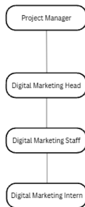
Gambar 2.3 Struktur Organisasi Internal Divisi Digital Marketing