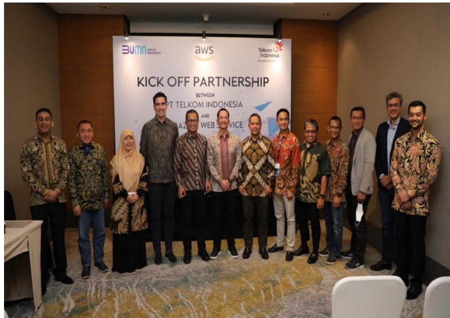
Gambar 2.3 Kejasama Telkom Indonesia dengan Amazon Web Service