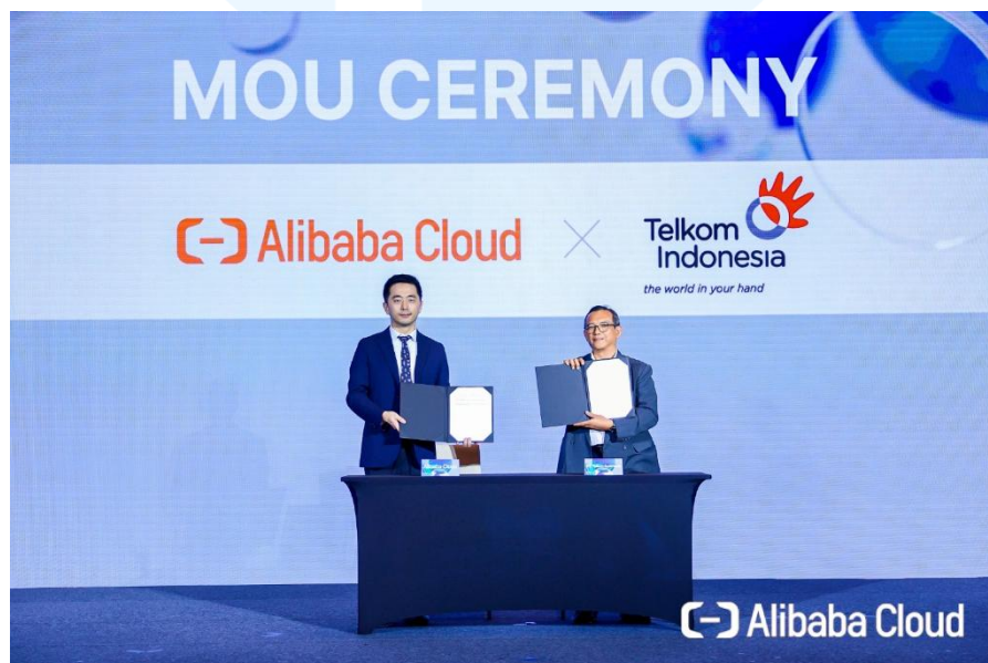
Gambar 2.4 Kejasama Telkom Indonesia dengan Alibaba cloud

Pada gambar 2.3 dan 2.4 Telkom Indonesia menjalin kerja sama strategis dengan berbagai perusahaan teknologi global seperti Amazon Web Services (AWS), Alibaba Cloud, Google Cloud, dan Fortinet. Kerja sama tersebut dilakukan untuk memperkuat layanan cloud computing, data center, big data, serta keamanan