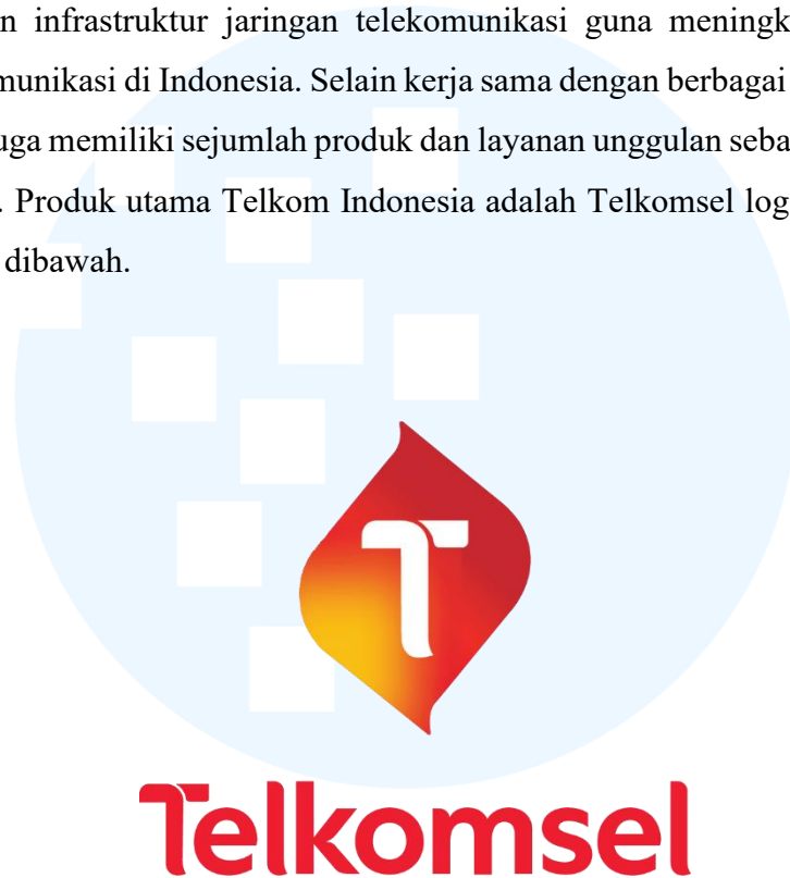
Gambar 2.5 Logo Telkomsel

siber bagi pelanggan enterprise dan pemerintahan. Selain itu, Telkom Indonesia juga bekerja sama dengan perusahaan telekomunikasi nasional seperti Indosat Ooredoo Hutchison, XL Axiata, dan Smartfren dalam pengembangan dan pemanfaatan infrastruktur jaringan telekomunikasi guna meningkatkan kualitas layanan komunikasi di Indonesia. Selain kerja sama dengan berbagai mitra, Telkom Indonesia juga memiliki sejumlah produk dan layanan unggulan sebagai hasil karya perusahaan. Produk utama Telkom Indonesia adalah Telkomsel logonya ada pada gambar 2.5 dibawah.