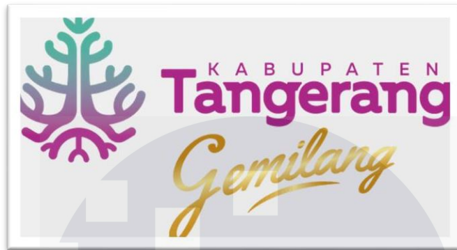
Gambar 1 2.1 Dinas Komunikasi dan Informatika Kabupaten Tangerang

Dinas Komunikasi dan Informatika (Diskominfo) Kabupaten Tangerang merupakan perangkat daerah yang memiliki fungsi dalam pengelolaan urusan pemerintahan di bidang komunikasi, informatika, persandian, dan keterbukaan informasi publik. Berdasarkan informasi yang tercantum pada situs resmi Pemerintah Kabupaten Tangerang, keberadaan Diskominfo merupakan hasil penataan ulang struktur organisasi perangkat daerah yang disesuaikan dengan kebijakan nasional terkait tata kelola teknologi informasi pemerintah daerah (Diskominfo Kabupaten Tangerang). Penataan struktur tersebut dilaksanakan sebagai upaya untuk memperkuat kemampuan pemerintah daerah dalam menyediakan layanan informasi yang berkualitas, efektif, serta mudah diakses oleh masyarakat.