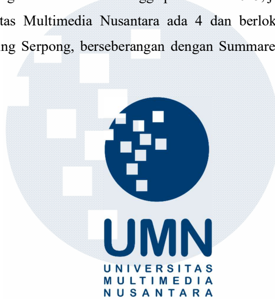
Gambar 2.1 Logo Universitas Multimedia Nusantara (UMN)

Garden diresmikan sebagai kampus tetap. Pada awalnya gedung pertama (Gedung A) berfungsi sebagai gedung rektorat dan gedung kedua (Gedung B) berfungsi sebagai gedung untuk kegiatan perkuliahan. Pada tahun 2012 Universitas Multimedia Nusantara membangun gedung ketiga (Gedung C) dan telah diresmikan, serta pembangunan gedung keempat dilakukan pada tahun 2017 dengan P.K. Ojong - Jacob Oetama. Hingga pada tahun 2025, jumlah gedung yang ada di Universitas Multimedia Nusantara ada 4 dan berlokasi di Jl. Scientia Boulevard, Gading Serpong, berseberangan dengan Summarecon Digital Center (SDC).