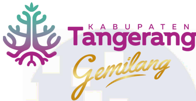
Gambar 2.1 Logo Dinas Komunikasi dan Informatika Kabupaten Tangerang

Dinas Komunikasi dan Informatika (Diskominfo) Kabupaten Tangerang merupakan perangkat daerah yang memiliki tugas dan fungsi dalam penyelenggaraan urusan pemerintahan di bidang komunikasi dan informatika, persandian, serta keterbukaan informasi publik. Identitas instansi ini ditunjukkan melalui logo resmi yang ditampilkan pada Gambar 2.1, yang merepresentasikan semangat pelayanan, keterbukaan, dan kemajuan teknologi dalam mendukung pembangunan daerah. Keberadaan Diskominfo menjadi bagian penting dalam sistem pemerintahan daerah, khususnya dalam pengelolaan dan penyampaian informasi kepada masyarakat.