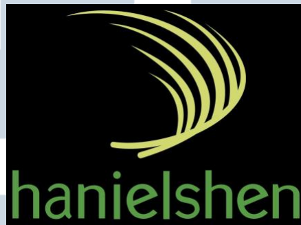
Gambar 2.1. Logo perusahaan PT Hanielshen

nasional dan internasional dengan tingkat kesulitan yang beragam. Keberhasilan perusahaan dalam menyelesaikan proyek-proyek besar tidak dapat dipisahkan dari kekuatan kolaborasi internal, ketelitian dalam perencanaan, serta budaya kerja yang menekankan profesionalisme dan kreativitas.