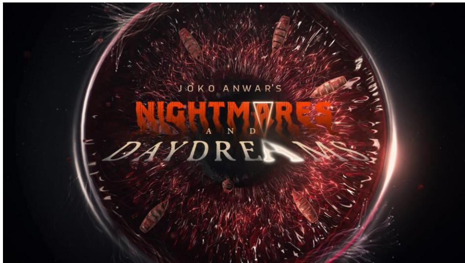
Gambar 2.4 Nightmares & Daydreams