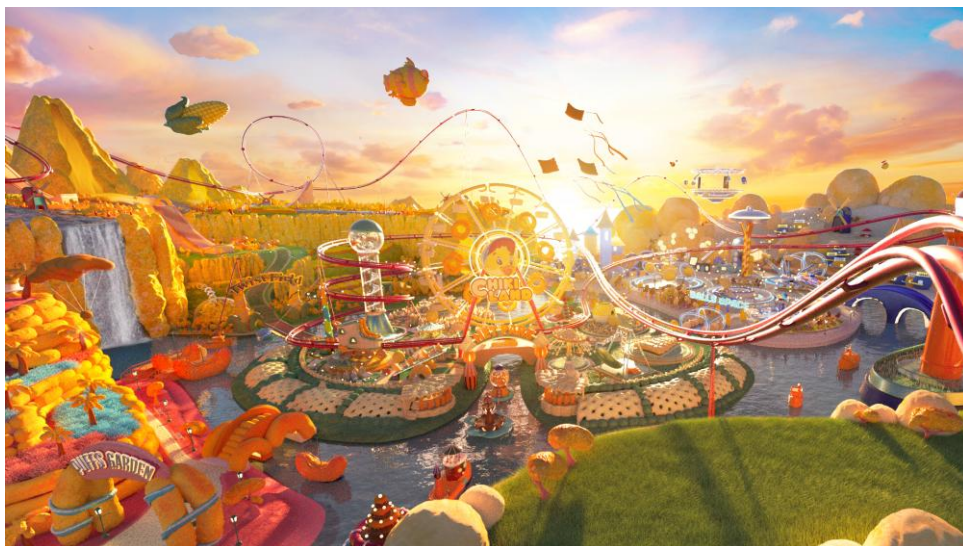
Gambar 2.5 Play Next Level

Chiki merupakan brand local makanan ringan yang memiliki karakter atau mascot berupa bebek yang mengenakan topi. Tim Aras Design & Motion mengerjakan environment berupa dunia yang berisikan produk dari Chiki dengan pembawaan style cartoon .