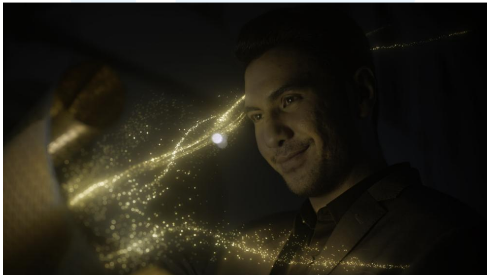
Gambar 2.3 DSS Golden Scroll (Sumber: aras.us, 2024)

DSS Golden Scroll adalah proyek iklan yang digarap oleh Aras Design & Motion dengan Dji Sam Soe sebagai client . Iklan ini menawarkan visual efek magical dust dan golden scroll yang menjadi media untuk orang bergabung dalam march for a masterpiece walk .