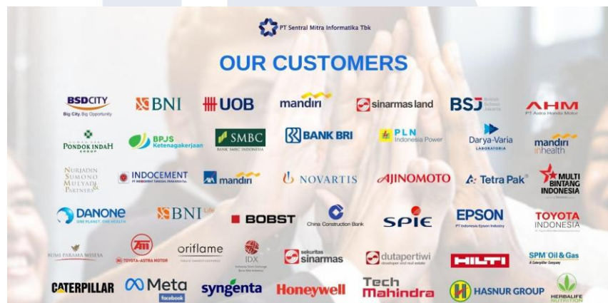
Gambar 2.4 Our Customers

Beberapa klien besar yang telah bekerja sama dengan SMI antara lain BNI, UOB, Bank Mandiri, PLN, Astra Honda Motor, BPJS Ketenagakerjaan, Danone, Toyota Indonesia, Meta, dan berbagai institusi lainnya. Keragaman kerjasama ini menunjukkan posisi SMI sebagai penyedia solusi IT yang kredibel dan adaptif terhadap kebutuhan industri.