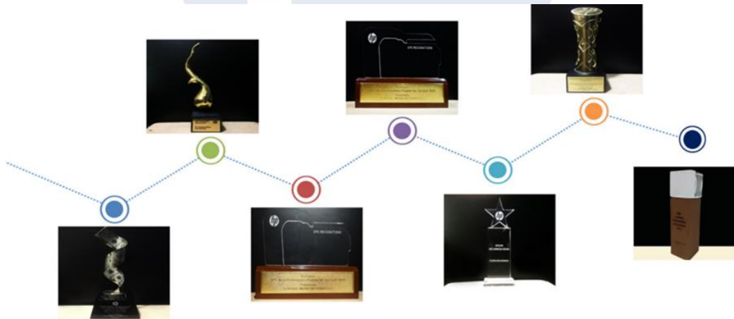
Gambar 2.5 Bukti Penghargaan Perusahaan

Pencapaian tersebut menjadi bukti komitmen perusahaan dalam memberikan layanan terbaik, mengembangkan inovasi teknologi, serta menjaga kepercayaan para klien di tengah persaingan industri yang semakin ketat. SMI terus memperkuat posisinya dan berinovasi secara berkelanjutan di industri teknologi informasi untuk mendukung transformasi digital di Indonesia.