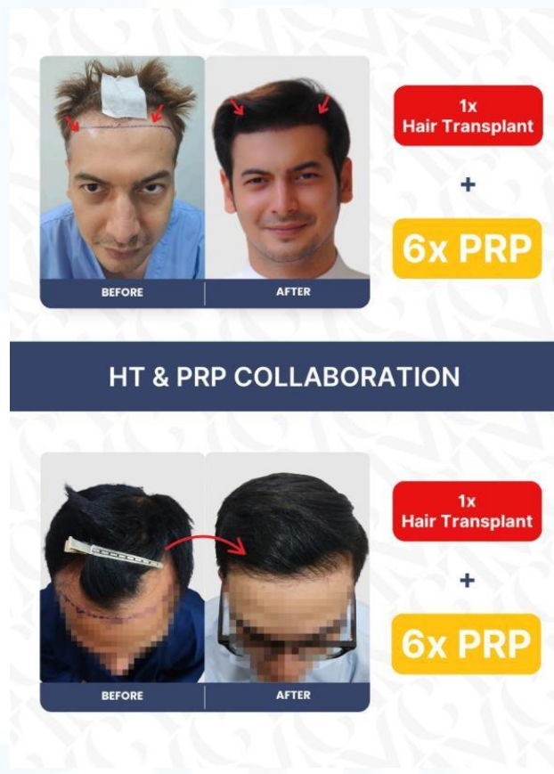
Gambar 2. 3 Portfolio The Men's Clinic

Sesuai dengan namanya, The Men's Clinic merupakan klinik yang berfokus pada perawatan pria terutama pada area rambut yaitu Hair Transplant . Meskipun berfokus untuk laki-laki, tetapi di The Men's Clinic juga menyediakan beberapa perawatan yang sama seperti yang disediakan di De-Hair Laser & Aesthetic.