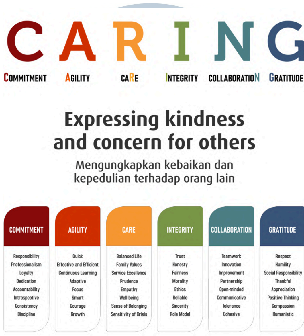
Gambar 2.13 Nilai Inti PT Summarecon Agung Tbk