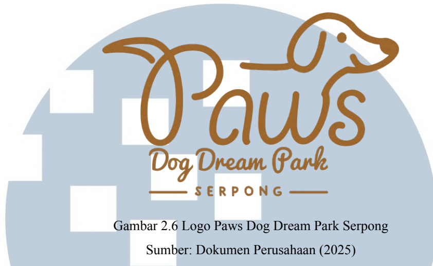
Gambar 2.6 Logo Paws Dog Dream Park Serpong