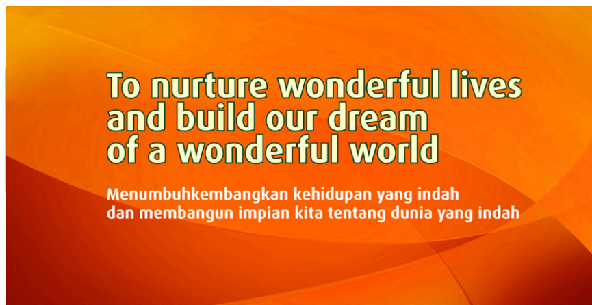
Gambar 2.10 Tujuan PT Summarecon Agung Tbk