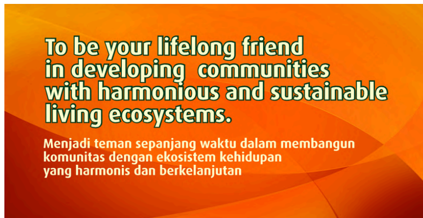
Gambar 2.11 Visi PT Summarecon Agung Tbk