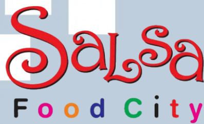
Gambar 2.2 Logo Pusat Makanan Salsa Food City

PT Lestari Mahadibya adalah salah satu anak perusahaan dari PT Summarecon Agung Tbk yang bergerak di bidang investasi properti. PT Lestari Mahadibya beroperasi sejak tahun 2006, dan terletak di Summarecon Mall Serpong, Sentra Gading Serpong, Jl. Boulevard Raya Gading Serpong, Pakulonan Barat, Kelapa Dua, Tangerang, Banten, menaungi: