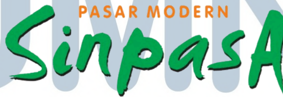
Gambar 2.3 Logo Pasar Modern Sinpasa

Pertama, Pusat Makanan Salsa Food City, destinasi kuliner dengan nuansa hijau pohon jati yang diresmikan pada tanggal 23 September 2004. Salsa Food City yang mengusung tema family food court , memiliki luas 3.500 m 2 , menyediakan 20 restoran dan lebih dari 800 kursi, serta menampilkan live music setiap malam.