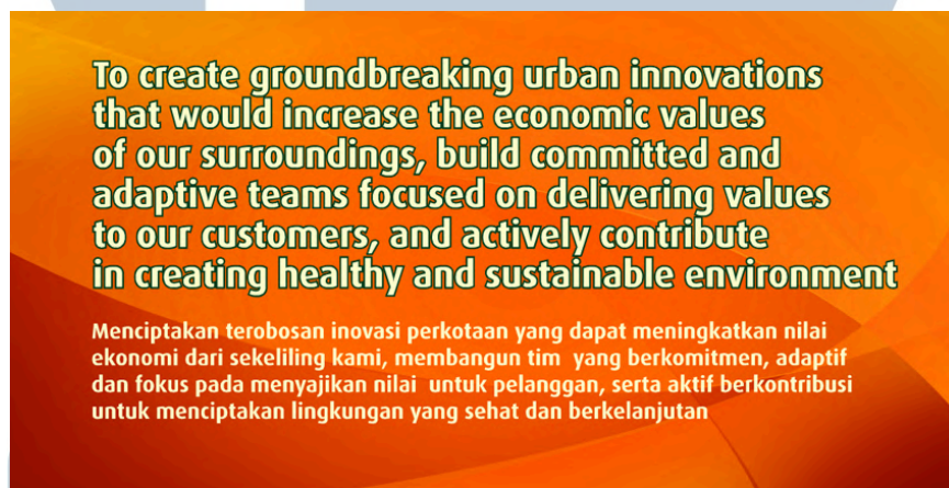
Gambar 2.12 Misi PT Summarecon Agung Tbk