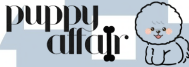
Gambar 2.7 Logo Puppy Affair

Di area Paws Serpong, terdapat 3 tenant pet-friendly , yang menawarkan berbagai produk/jasa berkaitan dengan hewan, khususnya anjing, yaitu: