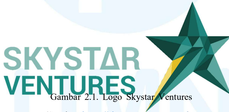
Gambar 2.1. Logo Skystar Ventures

Berdiri sejak awal tahun 2014, Skystar Ventures aktif berkontribusi dalam pengembangan entrepreneurship . Dengan beberapa pencapaian di tingkat nasional hingga internasional. Skystar Ventures telah memiliki lebih dari 20 collaborative working space yang dimanfaatkan oleh para peserta dan mahasiswa yang bergabung di dalam program inkubasi bisnis Skystar Ventures.