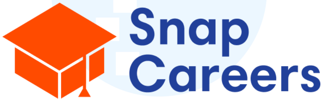
Gambar 2. 1 Logo Perusahaan SnapCareer

Snapcareer adalah sebuah perusahaan start-up yang di dirikan pada tahun 2022 dibawah naungan PT Snap Innovations Indonesia. Snapcareer merupakan sebuah perusahaan portal karir yang menyediakan platform bagi perusahaan yang ingin mencari kandidat dan kandidat yang sedang mencari pekerjaan.