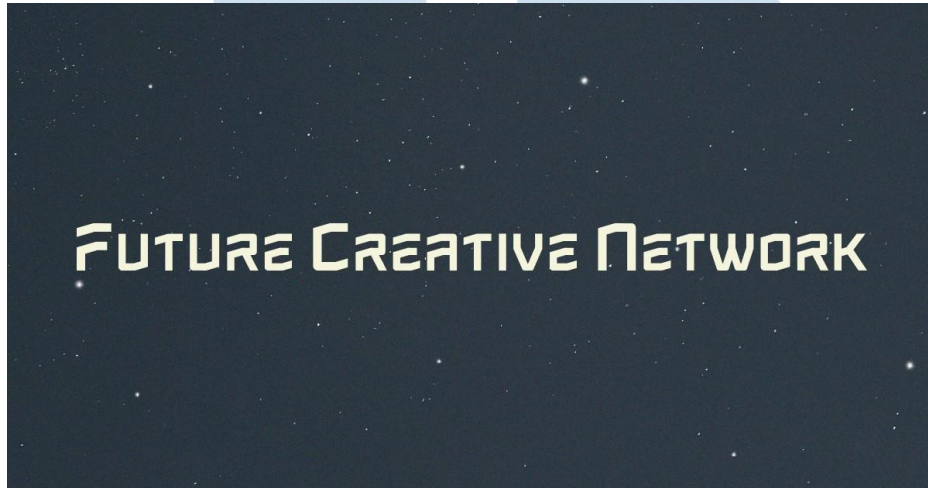
Gambar 2.1 Logo Perusahaan Future Creative Network (FCN Agency)