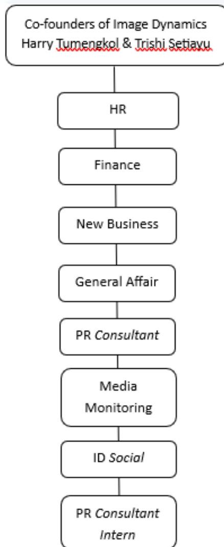
Gambar 2.2 Struktur Organisasi Image Dynamics PR