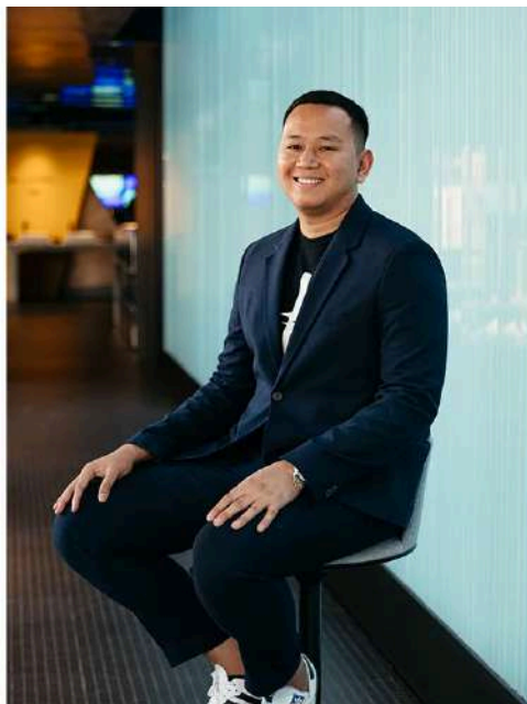
Gambar 2.3 CEO Alien Design Consultant