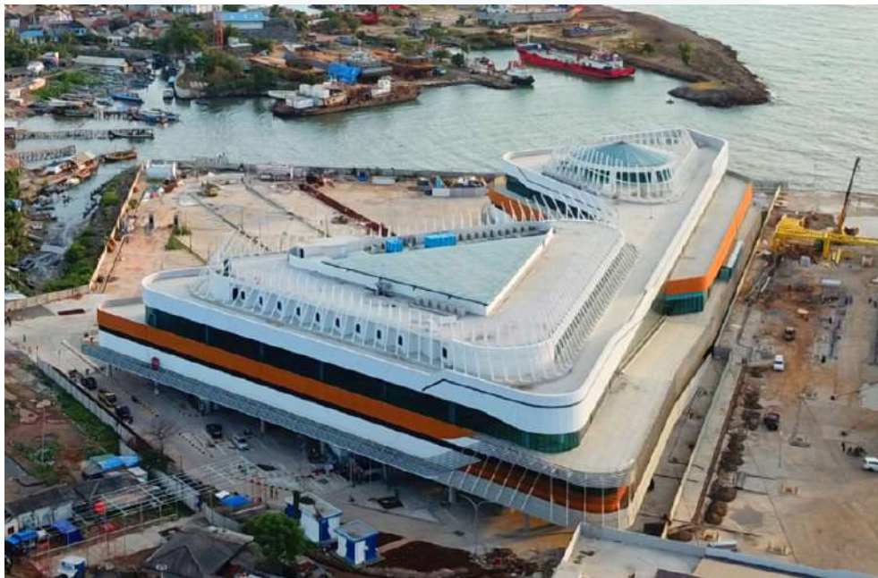
Gambar 2.4 Pelabuhan Merak