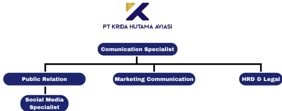
Gambar 2.6 Struktur organisasi perusahaan (penempatan intern )