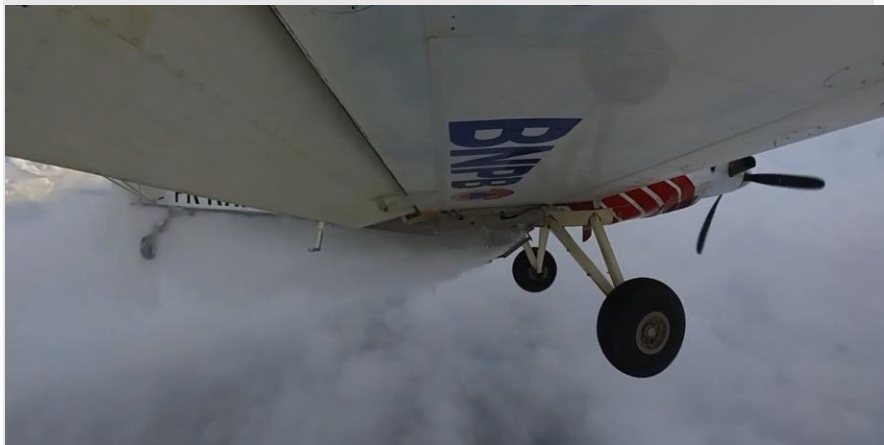
Gambar 2.3 Kegiatan Operasi Modifikasi Cuaca (OMC)

Operasi tersebut dinilai menjadi sebuah kesuksesan yang diraih oleh perusahaan untuk melaksanakan kegiatan water bombing dari Badan Nasional Penanggulangan Bencana (BNPB) dan memberikan hak agar bisa mengikuti kegiatan tersebut untuk kedepannya yang berlandaskan pada nilai perusahaan. Oleh karena itu, ini menjadi awal mula bagi perusahaan agar dapat mengekspansi bisnis lebih lanjut lagi kedepannya.