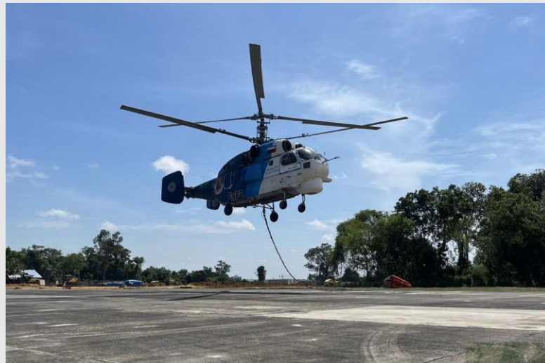
Gambar 2.2 Kegiatan water bombing perusahaan

Diketahui juga bahwasanya sistem pekerjaan yang diterapkan pada perusahaan ini adalah erat kaitannya dengan Business to Business (B2B) dikarenakan kebutuhan perusahaan dalam hal peminjaman pesawat dan helikopter dari perusahaan lainnya.