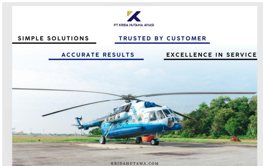
Gambar 2.4 Nilai perusahaan

Dalam layanan jasa operasi khusus, PT. Krida Utama Aviase memiliki nilai-nilai perusahaan yang dapat menjadi komitmen perusahaan dalam menjalani aktivitasnya.