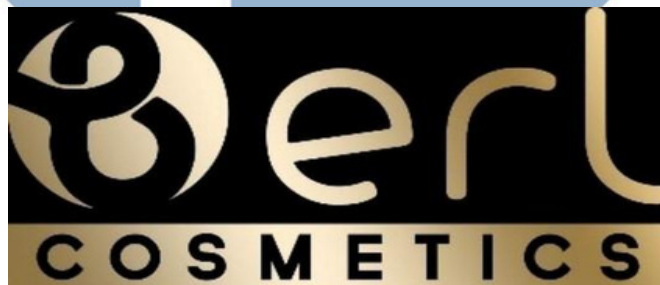
Gambar 2.1 Logo B ERL Cosmetics

B ERL Cosmetics bekerja sama dengan pabrik besar dan terpercaya di Indonesia yang telah memperoleh sertifikasi Halal dari MUI. Didukung oleh tim R&D terbaik yang senantiasa berinovasi dan berkomitmen untuk menyediakan produk perawatan kulit dan kosmetik berkualitas premium guna mewujudkan cita-cita perusahaan, yakni membantu setiap individu untuk mewujudkan kecantikan sejati mereka. Filosofi kecantikan sejati bagi B ERL adalah ketika seseorang mampu melihat keindahan secara utuh dalam dirinya. Karisma yang terpancar dari penampilan yang sehat, bersih, dan bercahaya merupakan refleksi dari pribadi yang menyenangkan, tercermin melalui tutur kata yang santun, pikiran positif, dan hati yang damai. Hingga saat ini, B ERL Cosmetics memiliki lebih dari 60.000 member yang tersebar di seluruh Indonesia dan Asia.