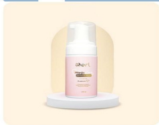
B ERL Manjacare Feminine Wash