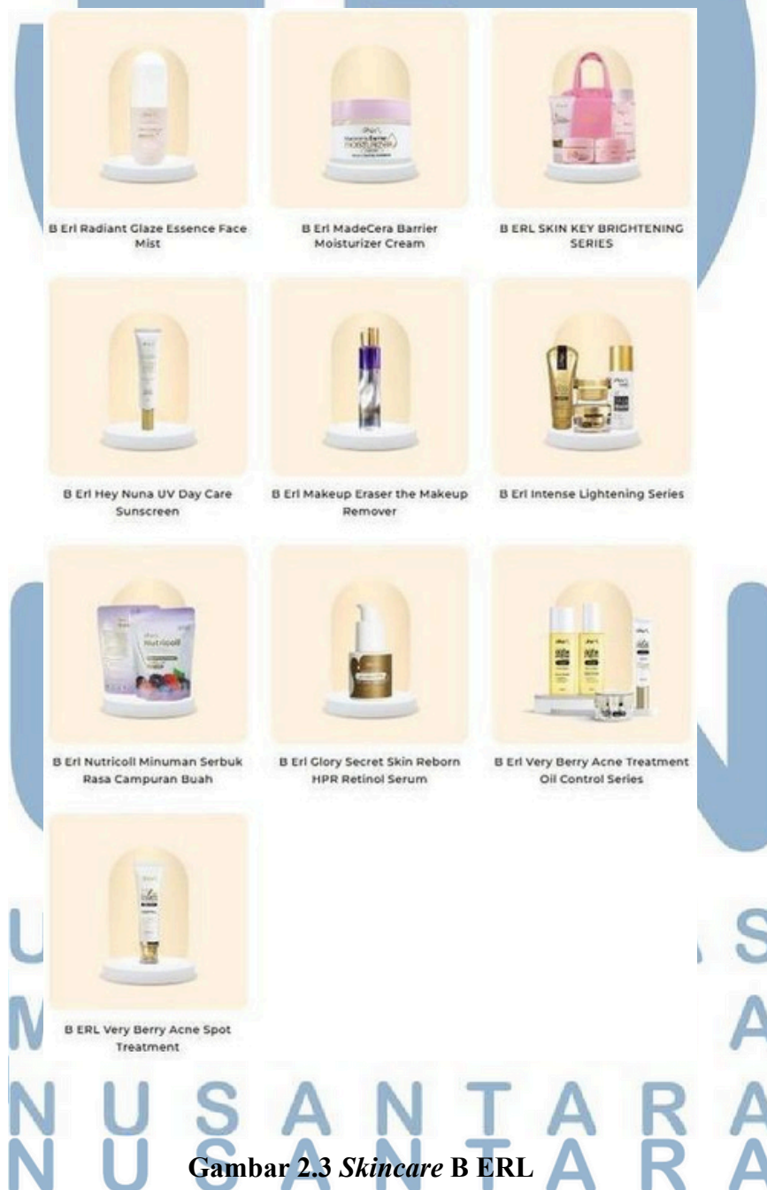
Gambar 2.3 Skincare B ERL