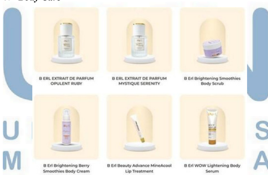
Gambar 2.4 Body Care B ERL