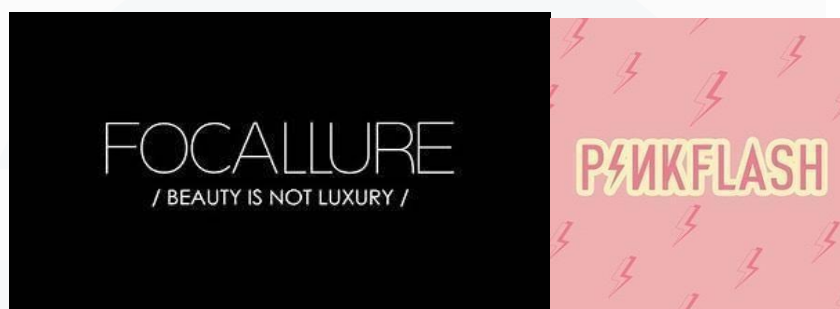
Gambar 2.1 Logo Focallure & PinkFlash

(Gambar 2.1. )