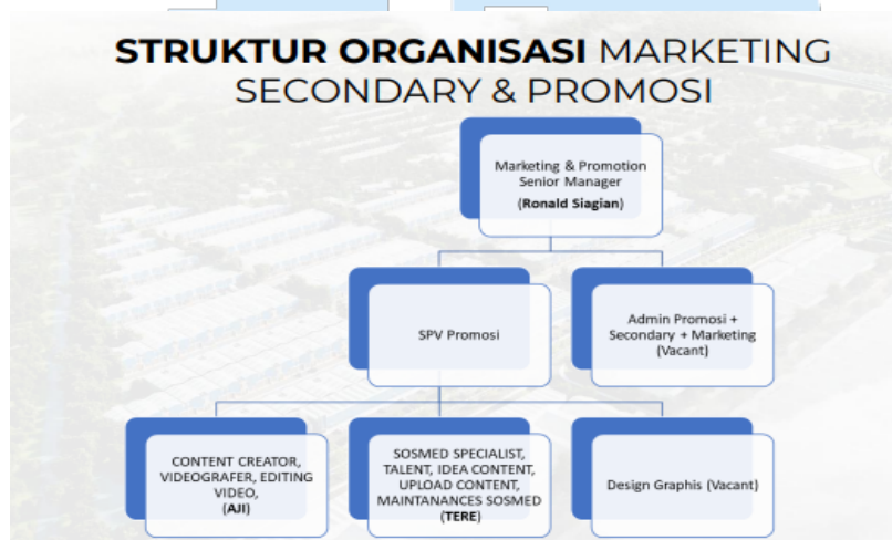
Gambar 2.2 Struktur Organisasi Marketing