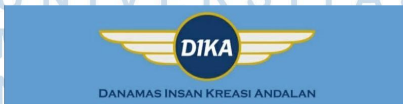
Gambar 2.1 Logo PT Danamas Insan Kreasi Andalan