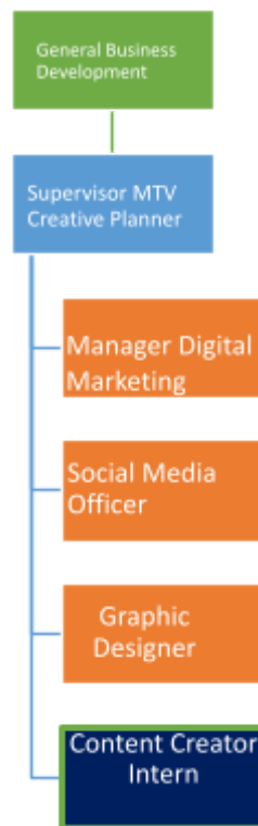
Gambar 2.5 Struktur Departemen MTV Creative

Di PT DIKA, tim marketing communication dibentuk secara terstruktur untuk mendukung fungsi bisnis utama perusahaan sebagai penyedia solusi outsourcing . Tim ini dipimpin oleh General Business Development yang bertanggung jawab atas pengembangan strategi kemitraan dan inisiatif bisnis baru. Di bawah General Business Development terdapat beberapa posisi kunci dalam satu kesatuan tim kreatif dan digital, yaitu Supervisor MTV Creative Planner , Manager Digital Marketing , Social Media Officer , Graphic Designer dan Content Creator Intern dan memiliki struktur organisasi sebagai berikut :